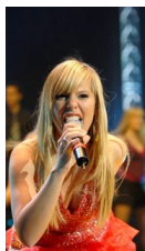
Bij haar deelnames aan 'Steracteur sterartiest' en 'Sterren op de dansvloer'.

"De wereld wordt weer veel mooier. Ik vind mijn draai in Antwerpen en krijg allerlei rollen aangeboden. Ik doe mee aan Sterren op de dansvloer en aan 71 graden noord . Ik ga ook aan de slag als veejay bij jongerenzender JIM. Zalig. Ik mag direct een dagelijkse liveshow presenteren, festivals verslaan en film-interviews in het buitenland doen. The Big Life . Het bruist in mijn leven. Ik geniet."