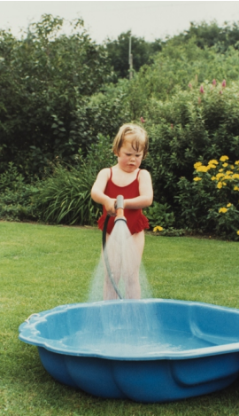
Als kleuter in de tuin. "Ik was een haantje-de-voorst, vrees ik."