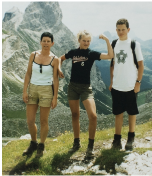
Op vakantie in de bergen. "Mama was pedicure in bijberoep en papa was vaak weg. Toch had ik nooit het gevoel dat we alleen waren."

"Ik groei op in een rustige, doodlopende straat in Beveren. Aan de spoorlijn, die vlak achter onze tuin loopt. Ik zie de treinen vanuit mijn slaapkamer. Hun geluid hoor ik al niet meer. Ik speel vaak op straat met mijn vriendjes. Ik ben niet op mijn mond gevallen. Heb best een franke teut en wil gezien worden. Ik doe ballet. Als ik aankom, durf ik zelfs af en toe de andere kinderen opzij duwen zodat ik op de eerste rij sta. De moeders van andere kindjes draaien geregeld met hun ogen. Daar heb je ze weer . Ik ben een haantje-de-voorst, vrees ik. Maar ik ben ook een heel vrolijk meisje en heb veel vriendjes." "Mijn mama doet pedicure in bijberoep en mijn vader is vaak weg, maar toch heb ik het gevoel dat we nooit alleen zijn. We eten altijd samen. Ik kan nu nog altijd niet begrijpen dat sommige gezinnen niet samen eten."