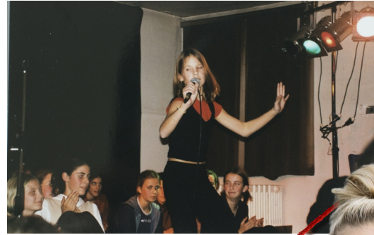
"Al op mijn 10de wilde ik me inschrijven voor Studio Herman Teirlinck."